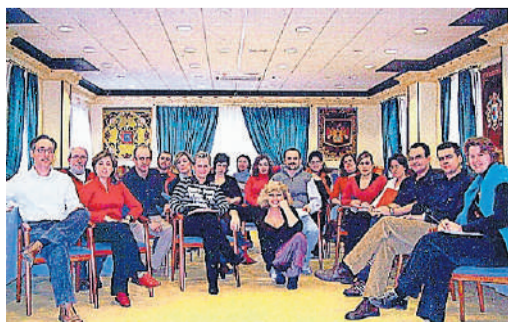
Inolvidable curso en el hotel San Camilo.