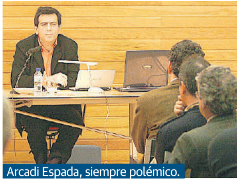
Arcadi Espada, siempre polémico.