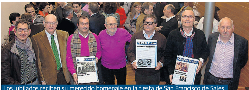
Los jubilados reciben su merecido homenaje en la fiesta de San Francisco de Sales.