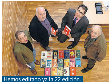
Hemos editado ya la 22 edición.