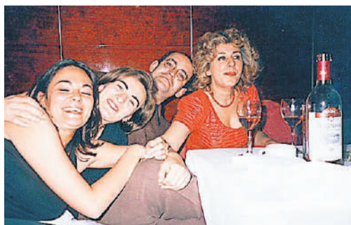
Nos enseñó la oratoria de las celebraciones.