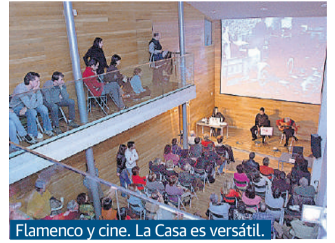
Flamenco y cine. La Casa es versátil.