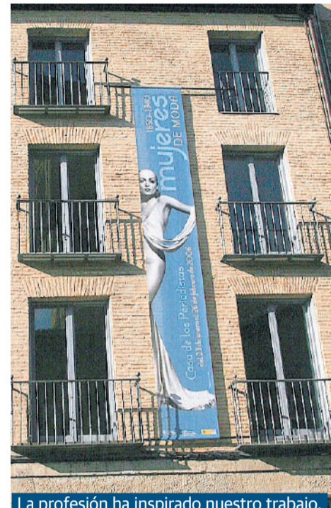
La profesión ha inspirado nuestro trabajo.