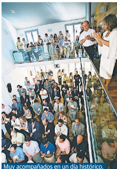
Muy acompañados en un día histórico.