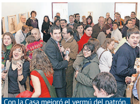
Con la Casa mejoró el vermouth del patrón.