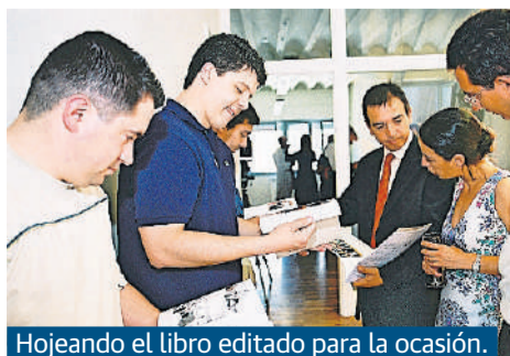
Hojeando el libro editado para la ocasión.