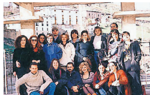
Curso con retiro incluido, en Villoslada.