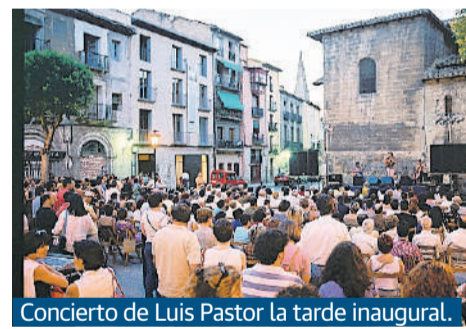
Concierto de Luis Pastor la tarde inaugural.