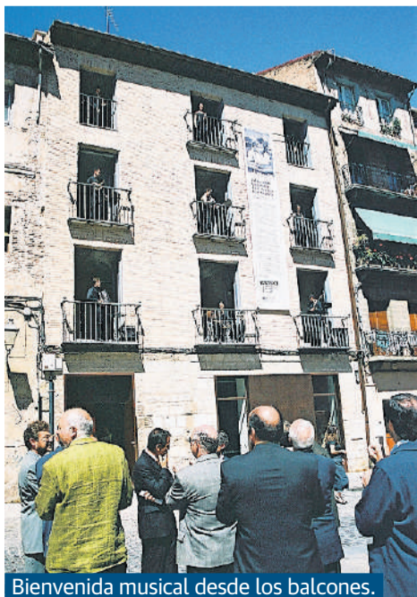
Bienvenida musical desde los balcones.