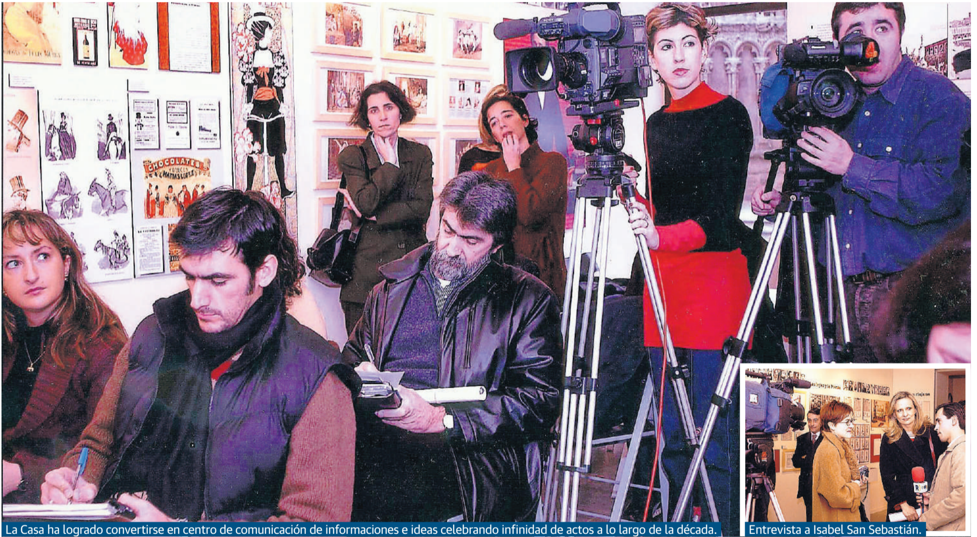
La Casa ha logrado convertirse en centro de comunicación de informaciones e ideas celebrando infinidad de actos a lo largo de la década.