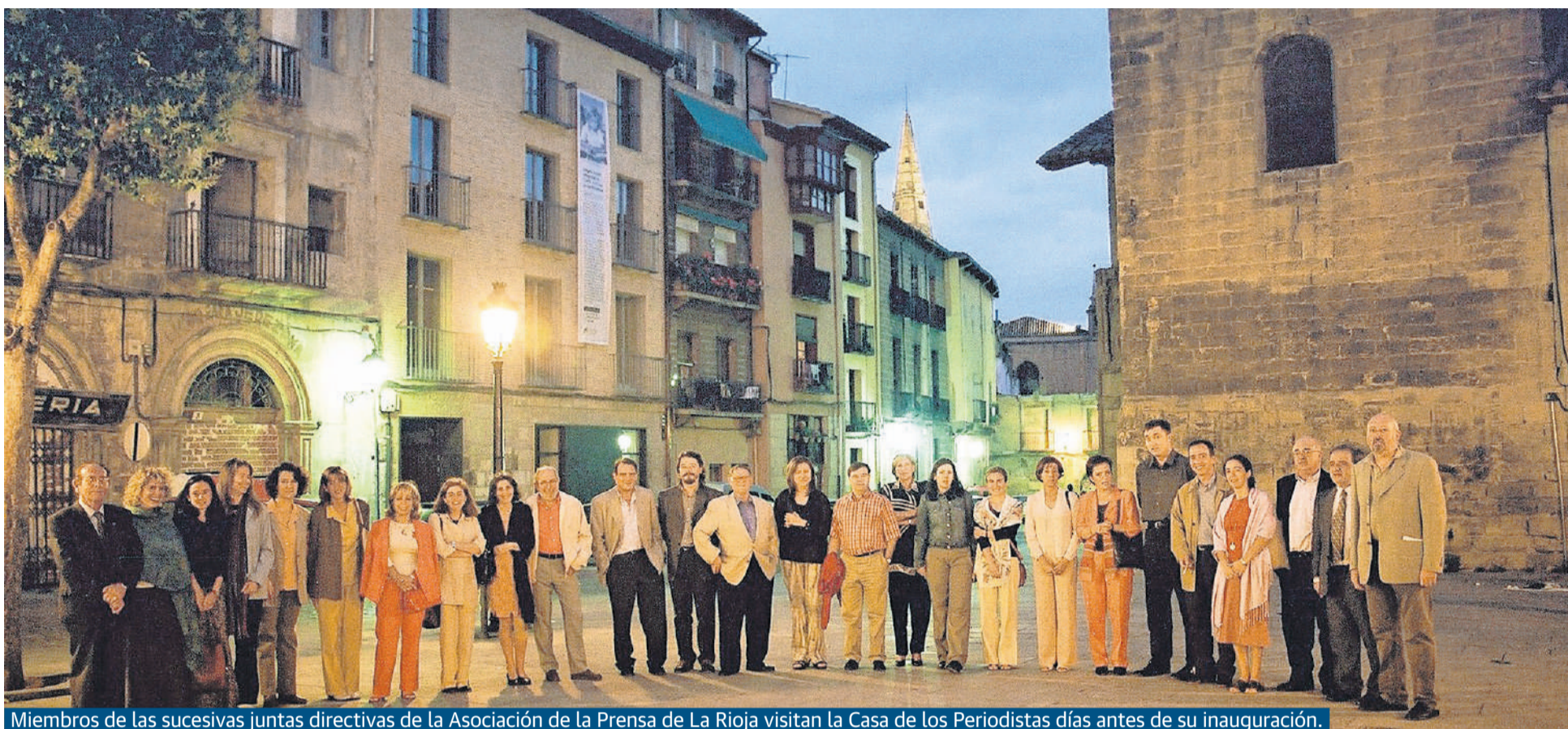
Miembros de las sucesivas juntas directivas de la Asociación de la Prensa de La Rioja visitan la Casa de los Periodistas días antes de su inauguración.

Hoja informativa especial editada con motivo del X Aniversario de la Casa de los Periodistas . Viernes, 17 de junio de 2011 Asociación de la Prensa de La Rioja. Fundada en el año 1913 . Plaza de San Bartolomé, 5. Logroño. La Rioja.