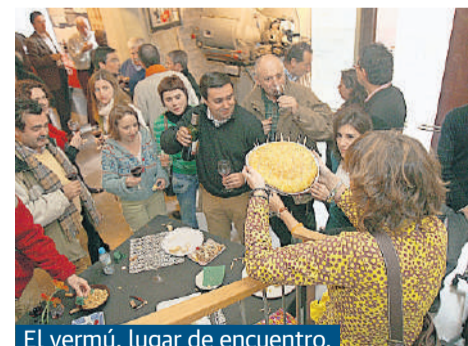
El vermouth, lugar de encuentro.