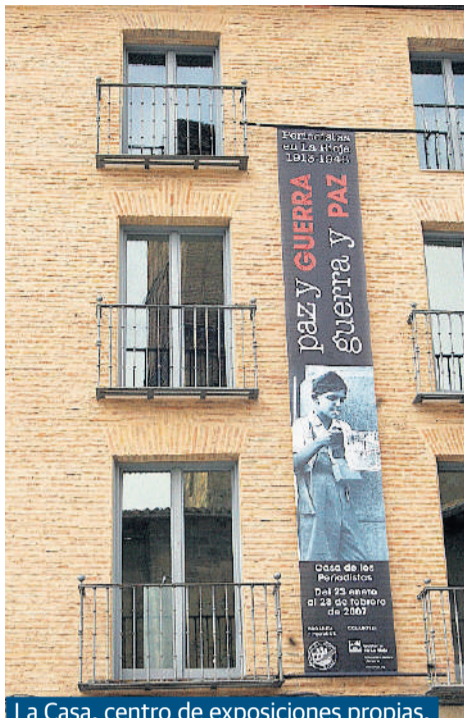
La Casa, centro de exposiciones propias.