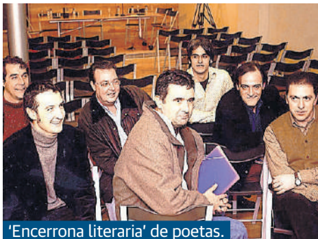
'Encerrona literaria' de poetas.