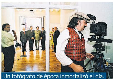
Un fotógrafo de época inmortalizó el día.