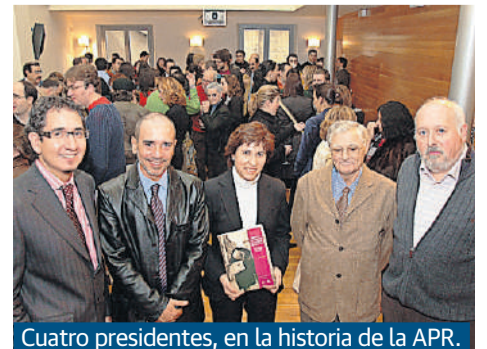
Cuatro presidentes, en la historia de la APR.