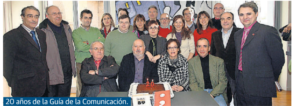
20 años de la Guía de la Comunicación.