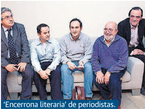
'Encerrona literaria' de periodistas.