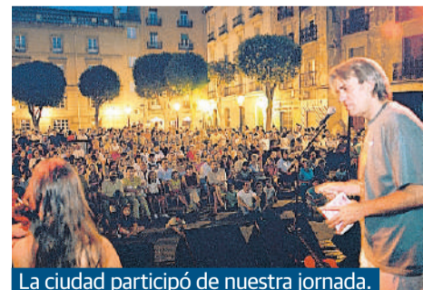
La ciudad participó de nuestra jornada.